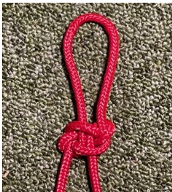
Représentation du nouage sur ses deux faces